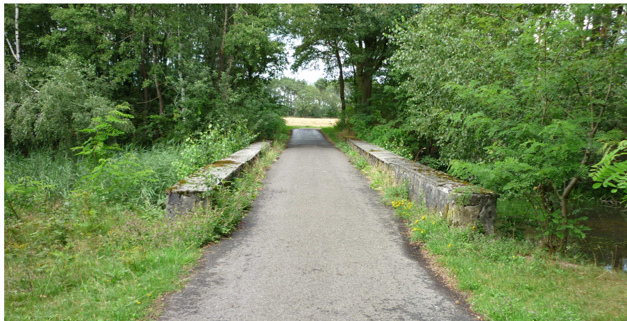
Brücke über dem Bodelschwingh-Stollen, von Süden gesehen