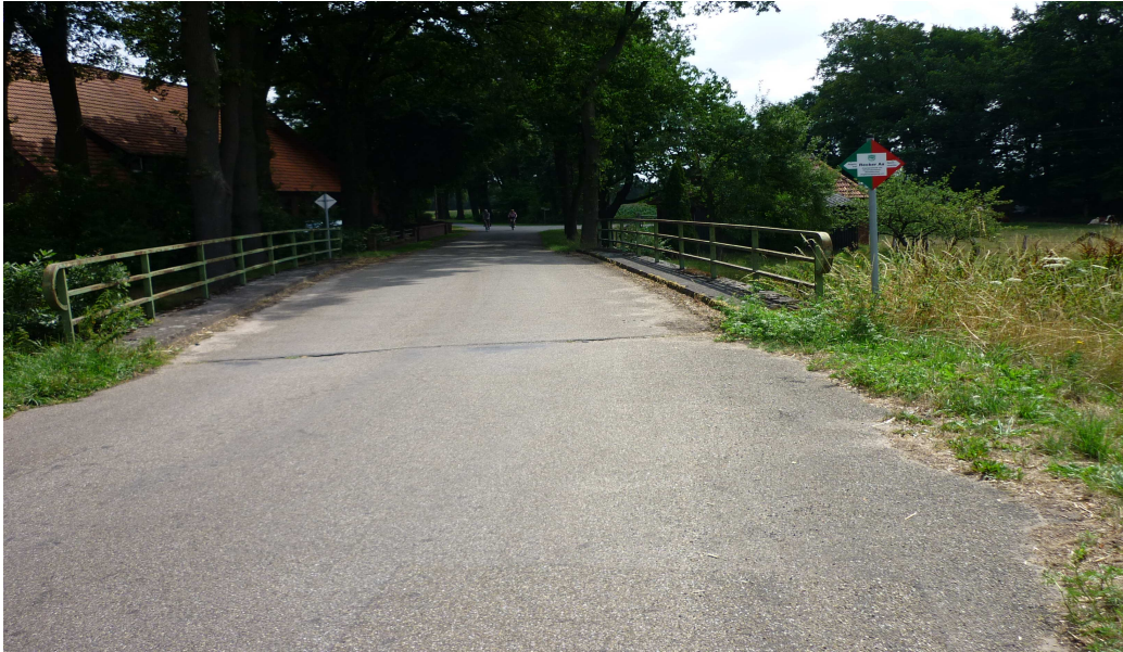
Die Aa-Brücke in Twenhusen und Hammermühle-Abzweig an der Straße: Recke- Hopsten

11 Im Kreienfeld (Nähe Napoleon-Damm = GPS 53,3957°N / 7,6716°O) knickt die Grenze , von der Hammermühle kommend , nach Nord-West zum Windmühlenfeld ab (am Bardelgraben- Moorkanal längs), um dann geteilt nach Nordost zur Messlage und westlich zur Grenze und Speller Aa zu führen (Untergrafschaft Lingen) Die Messlage ist das Gebiet der damaligen Exklave Schale und gehörte den Herren von der Grafschaft Tecklenburg .