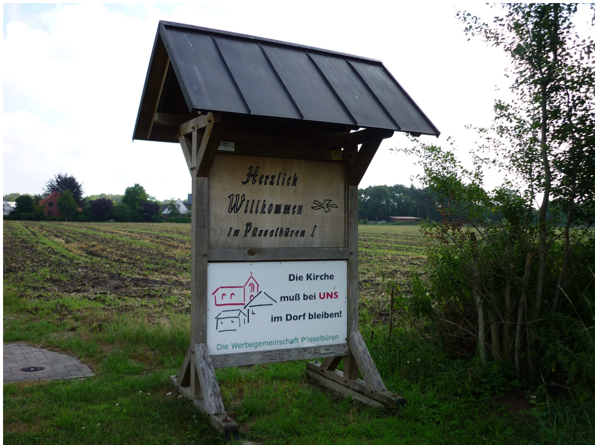
An der Grenze Ibbenbüren / Püsselbüren - Hörstel /Gravenhorst