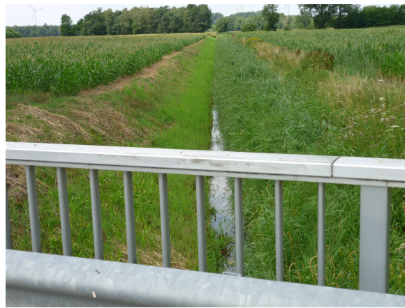
Die Bardelgraben-Brücke an der Straße: Hopsten-Halverde