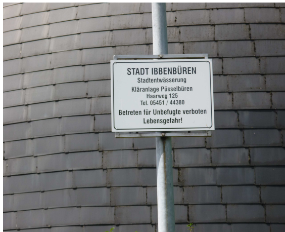
Gravenhorster Straße (Ibb)