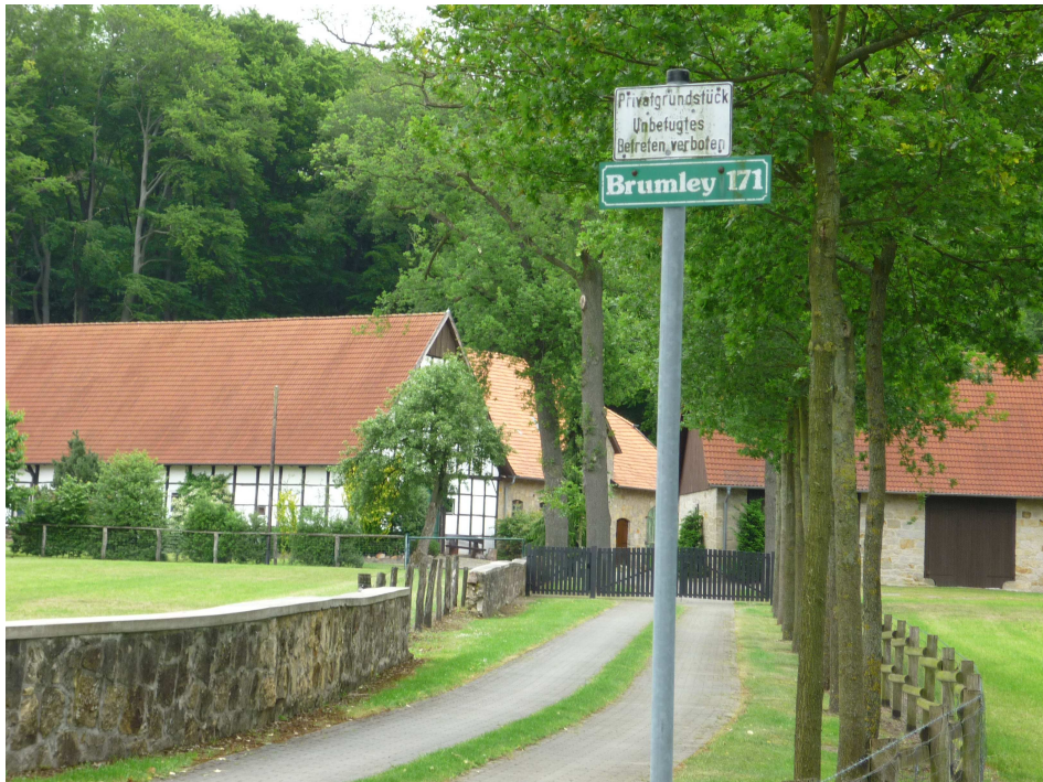
Der Brumley-Hof in Dörenthe-Birgte