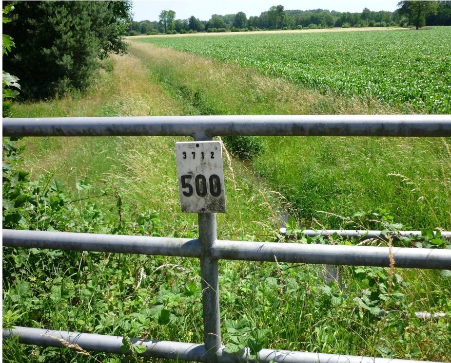
Der Grenzbach Aa, westlich der Straße beim Hof Spieker