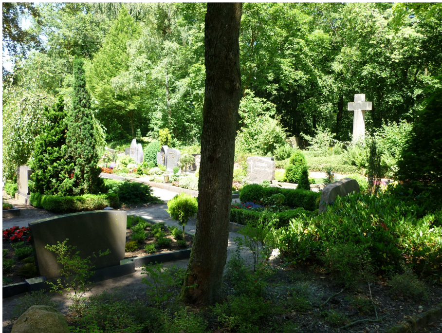
Der Friedhof in Dörenthe, direkt am DE-Kanal