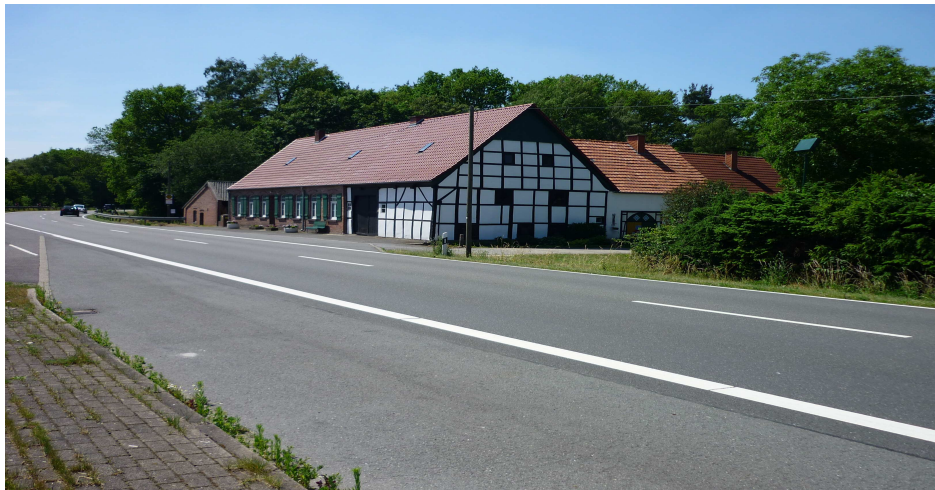
Hof Spieker im Saerbecker Feld, westlich der Straße, mit Scheune östlich der Straße