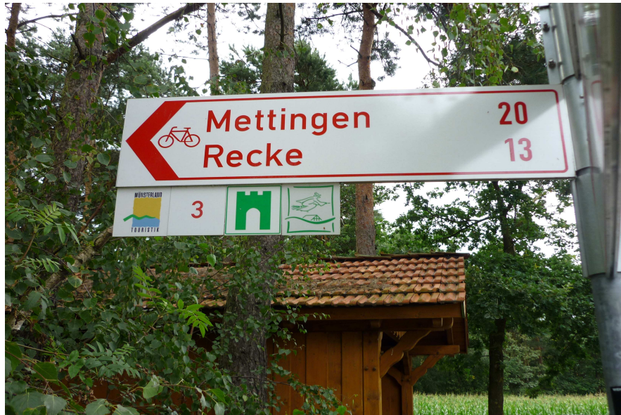
Schutzhütte am Grenzpunkt